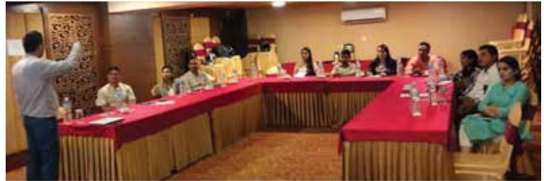
Taxation at Kathmandu (2079.05.18)