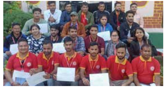
Sales &amp; Customer Service Excellence at Dadeldhura (2079.05.25)