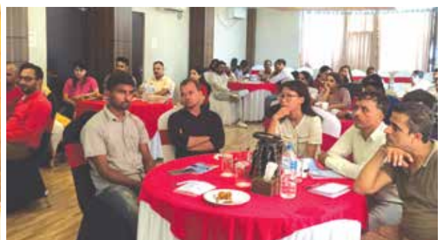
Sales & Customer Service Excellence at Butwal (2079.06.08)