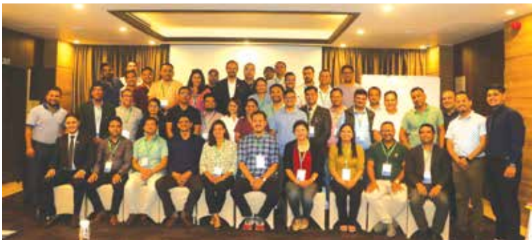
Leadership Managing Up & Down at Kathmandu (2079.04.21)