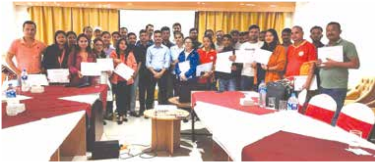
AML/CFT, Transaction Banking & Cyber Security Awareness at Nepalgunj (2079.06.01)